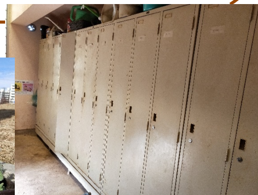
個人用ロッカーあり!