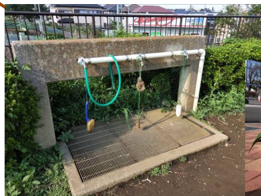
水道利用できます!